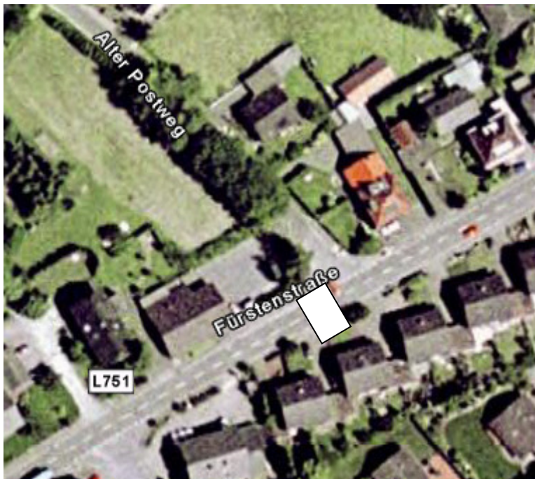
Querungshilfe an der Fürstenstr. /Alter Postweg

Aus Sicht des Arbeitskreises sollte die im Dorfentwicklungsplan vorgeschlagene Überquerungshilfe an der bestehenden Bushaltestelle Alter Postweg rasch umgesetzt werden. Der Kosten dafür sollten im Verhältnis zu den übrigen Projekten aus Sicht des Arbeitskreises gering ausfallen und entsprechend der erwarteten Wirkung vorgezogen werden.